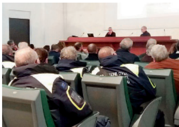
Corso sull'alluvione e sul fiume Bormida